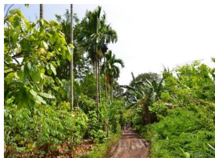
Gambar 2. Kondisi Pekarangan dan Hutan Lindung di KPH Batutegi sebagai Sumber Hasil Hutan Bukan Kayu Masyarakat