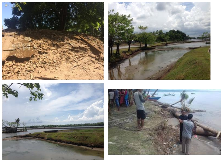
Gambar 2. Identifikasi areal yang mengalami abrasi di sekitar Benteng Sanrobone dan estimasi kegiatan rehabilitasi melalui penanaman mangrove

Kegiatan identifikasi lokasi rehabilitasi hutan mangrove di Desa Sanrobone bertujuan untuk mengetahui semua titik lokasi di wilayah pesisir Desa Sanrobone yang mengalami abrasi dan akan direhabilitasi dengan penanaman mangrove. Abrasi adalah suatu proses pengikisan pantai oleh tenaga gelombang laut dan arus laut yang bersifat merusak (BNPB, 2012). Abrasi terjadi disebabkan oleh gelombang akibat hembusan angin di permukaan air. Saat gelombang mendekati pantai, gelombang mulai bergesekan dengan dasar laut yang menyebabkan terjadinya turbulensi dan membawa material dari dasar pantai atau menyebabkan terkikisnya pasir di pantai (Pratikto et al. , 1997) (Gambar 2).