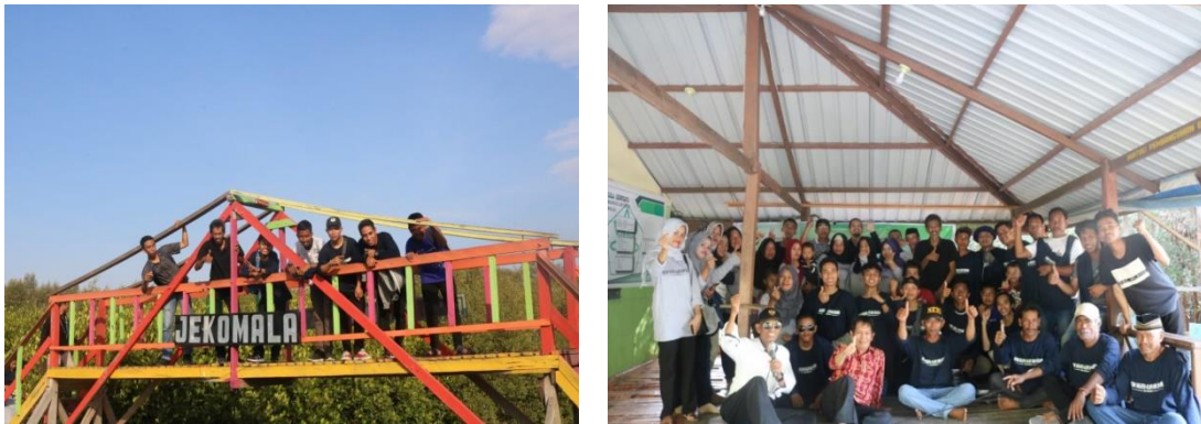
Gambar 7. Pelaksanaan studi banding di Wisata Mangrove Lantebung, Kota Makassar