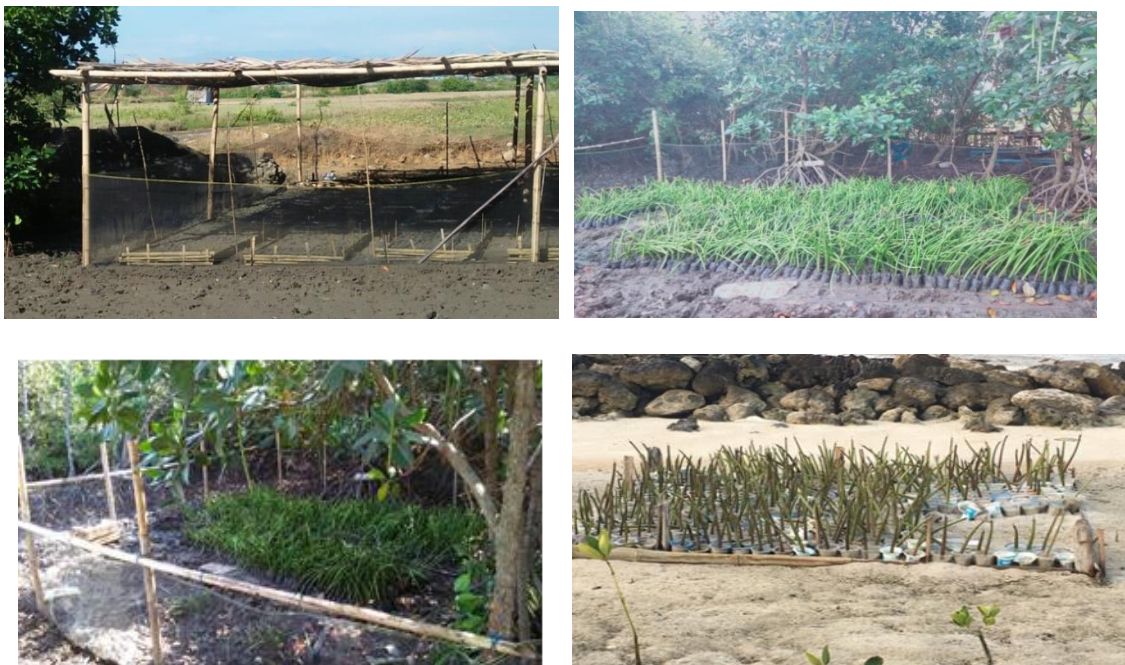
Gambar 3. Areal pembibitan mangrove di Lantebung (Makassar) dan PPLH Puntondo (Takalar)

Penyapihan bibit yang tepat harus didukung dengan sistem pengangkutan yang baik. Bibit diangkut dengan menggunakan truk terbuka agar bibit tetap mendapat udara segar. Bibit juga sebaiknya disiram sebelum diangkut ke dalam truk untuk menjaga cadangan air selama pengangkutan ke lokasi tujuan. Bibit mangrove diserahkan kepada kelompok pemuda untuk dipelihara sebelum dilakukan penanaman.