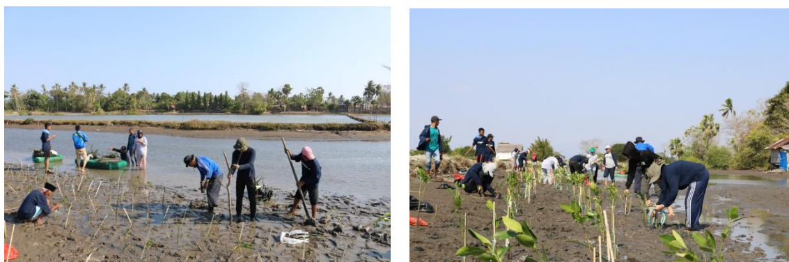
Gambar 5. Kegiatan penanaman mangrove jenis Rhizophora stylosa .