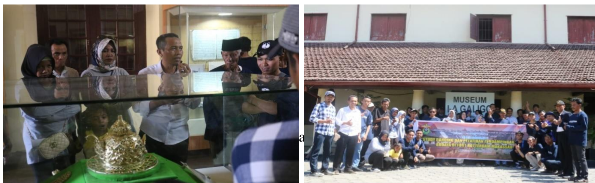
Gambar 6. Pelaksanaan studi banding di Benteng Fort Rotterdam, Kota Makassar

Kegiatan studi banding kelompok generasi milenial Desa Sanrobone dilakukan pada tanggal 16-17 Oktober 2019 di Kota Makassar pada dua tempat, yaitu Fort Rotterdam untuk belajar tentang wisata budaya dan Hutan Mangrove Lantebung untuk belajar tentang wisata mangrove (Gambar 6 dan Gambar 7). Kegiatan ini bertujuan untuk pengembangan sumber daya manusia khususnya generasi milenial di Desa Sanrobone dalam bidang wisata alam dan budaya, serta penguatan kelompok yang telah terbentuk.