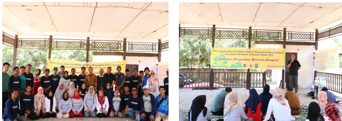
Gambar 4. Pelatihan pengelolaan ekosistem mangrove di Baruga rumah adat Sa nrobone

Kegiatan "Pelatihan Penanaman dan Pengelolaan Ekosistem Mangrove" dilaksanakan pada tanggal 7 September 2019 yang dihadiri oleh 40 orang, terdiri dari seluruh kelompok generasi milenial di Desa Sanrobone, Pemerintah Kecamatan Sanrobone, Kepala Desa Sanrobone, Kepala Dinas Kelautan dan Perikanan (DKP) Kabupaten Takalar, dan segenap tokoh masyarakat Desa Sanrobone. Kegiatan ini menghadirkan dua narasumber, yaitu akademisi dari Universitas Hasanuddin dengan materi penanaman dan pengelolaan ekosistem mangrove, dan praktisi dari Dinas Kelautan dan Perikanan Kabupaten Takalar dengan materi kebijakan pengelolaan ekosistem mangrove di Kabupaten Takalar. (Gambar 4)