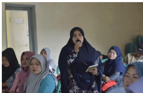
Gambar 5 Diskusi paralel.