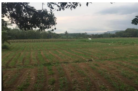
Gambar 2 Lahan pertanian di Cihideung Udik