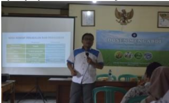
Gambar 6 Penyampaian materi dosen

Target peserta yang hadir setiap harinya adalah 30 orang. Jumlah peserta yang hadir di hari pertama adalah 28 orang, dan dihari kedua adalah 35 orang. Berdasarkan jumlah tersebut, tingkat partisipasi peserta telah memenuhi target.