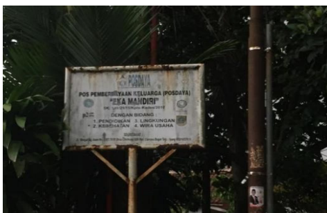
Gambar 1 Posdaya Eka Mandiri

Kegiatan Dosen Mengabdi dilaksanakan selama dua hari. Kegiatan Dosen Mengabdi berupa sosialisasi inovasi IPB dengan bidang yang sesuai dengan kondisi desa untuk memberikan solusi terhadap permasalahan yang ada. Rangkaian kegiatan dosen hari pertama berupa kegiatan sosialisasi dengan materi minat dan motivasi: mengenal potensi diri dan membangun “ future skill ”, perencanaan keuangan keluarga dan sistem irigasi hemat air dengan SRI. Sedangkan materi hari kedua antara lain pengelolaan air dan pengaturan pola tanam untuk budi daya hemat air, pengembangan sistem agrosilvofarmaka sebagai upaya peningkatan produktivitas tanaman kayu, pangan dan obat, pengenalan tumbuhan obat dan potensinya dalam pembangunan agrosilvofarmaka, pemasaran: mengelola hubungan pelanggan yang saling menguntungkan, serta pemetaan partisipatif potensi wisata dan pertanian di Desa Cihideung Udik berbasis teknologi 4.0