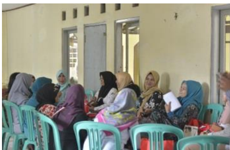
Gambar 4 Diskusi paralel.