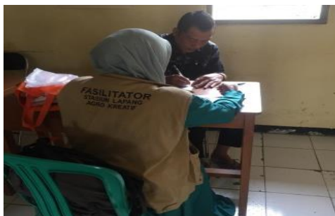
Gambar 3 Pengumpulan evaluasi kegiatan pada tanggal 12 Desember 2019

Kegiatan hari pertama dilanjutkan dengan diskusi secara paralel (Gambar 4) sedangkan di hari kedua diskusi setiap penyampaian materi (Gambar 5). Peserta yang hadir di hari pertama sebanyak 28 orang dan di hari kedua sebanyak 35 orang. Jumlah